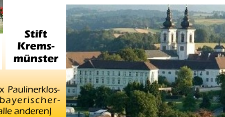
Stift Krems- münster

Seine Tätigkeiten sind daher in keiner Weise auf Gewinn ausgerichtet.