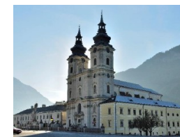
Spital am Pyhrn (ehem. Stift)

Europas, gilt als der Begründer des abendländischen Mönchtums und des Benediktinerordens. „Ora et labora et lege“, diese drei Lebensvollzüge prägen und kennzeichnen wesentlich die „Schule“ des Hl. Benedikt. Gebet und Gottesdienst, Arbeit und kontinuierliche Auseinandersetzung mit den biblischen Schriften und denen der Kirchen-