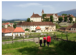
Benediktinerstift St. Paul im Lavanttal

Bereits 2009 anlässlich des 200-Jahr-Jubiläums der Wiederbesiedelung des Benediktinerstiftes St. Paul im Lavanttal wurde auf dem Pfad der damaligen Mönche ein Pilgerweg , benannt nach dem Heiligen Benedikt von Nursia, dem Patron Europas, errichtet. Er ist ein Weg der Begegnung und Bewegung in vielfältiger Hinsicht: Wer ihn geht, soll Ruhe und innere Einkehr finden, Gemeinschaft und Gastfreundschaft erfahren, aber auch Wandlung spüren und die Schöpfung bewusster wahrnehmen lernen. Der Weg führt von Spital am Pyhrn nach St. Paul im Lavanttal. 2011 wurde er bis nach Gornji Grad (Slowenien) verlängert. 2019 soll der Pilgerweg durch ganz Slowenien fertiggestellt werden. In Zusammenarbeit mit anderen Pilgerwegen in Italien soll man schließlich den Benediktweg bis Montecassino (Mittelitalien), dem Mutterkloster des Benediktinerordens und Grab des Heiligen Benedikt, gehen können (bzw. von dort nach Norden - später einmal nach Pluscarden, dem nördlichsten europ. und engl. Benediktinerkloster, führen).