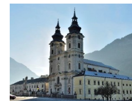
Spital am Pyhrn (ehem. Stift)

Europas, gilt als der Begründer des abendländischen Mönchtums und des Benediktinerordens. „Ora et labora et lege“, diese drei Lebensvollzüge prägen und kennzeichnen wesentlich die „Schule“ des Hl. Benedikt. Gebet und Gottesdienst, Arbeit und kontinuierliche Auseinandersetzung mit den biblischen Schriften und denen der Kirchen-