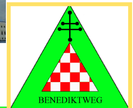
Verein BENEDIKT be-WEG-t Oberösterreich

väter bilden eine Einheit im benediktischen Lebensverständnis.