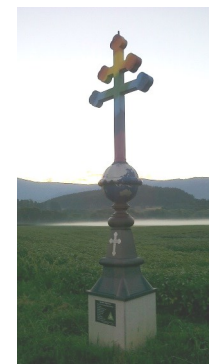
Benedikt Kreuz St. Paul