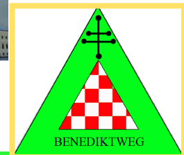
Verein BENEDIKT be-WEG-t Oberösterreich

väter bilden eine Einheit im benediktischen Lebensverständnis.