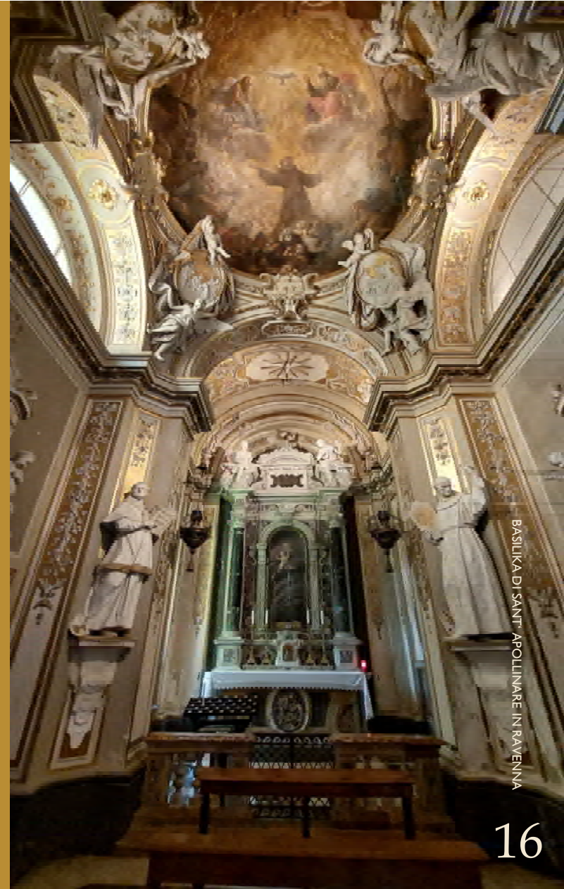
BASILIKA DI SANT' APOLLINARE IN RAVENNA